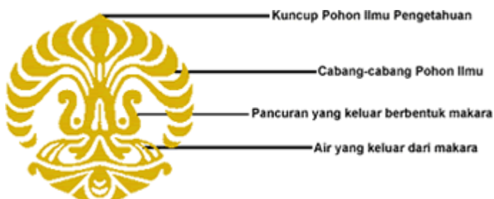
Logo Universitas Indonesia

Lambang Universitas Indonesia terdiri dari dua unsur, yaitu: pohon dengan cabang- cabangnya dan makara: